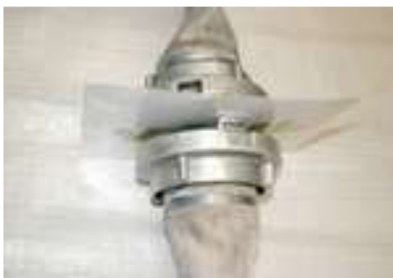
Obrázek 2 - Volně ložený list zalaminovaného papíru, pohled z boku