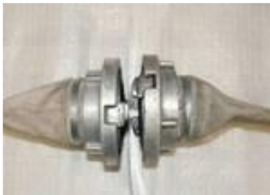
Obrázek 1 - Volně ložený list zalaminovaného papíru, pohled shora