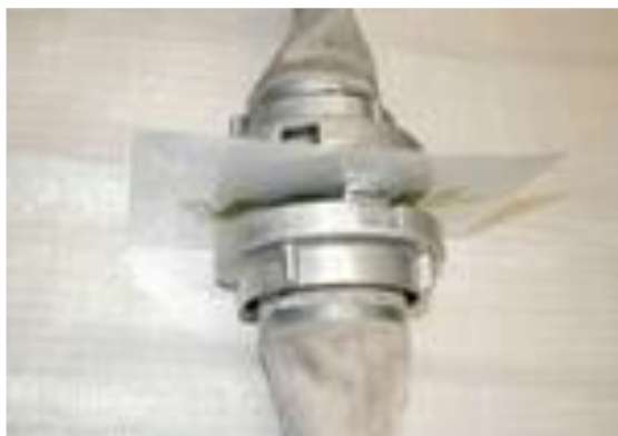
Obrázek 2 - Volně ložený list zalaminovaného papíru, pohled z boku